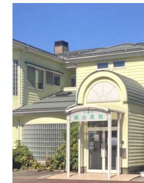
関谷医院まで徒歩4分 (270m)