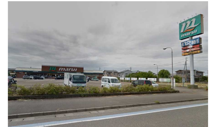
スーパーマルイまで徒歩2分 (160m)