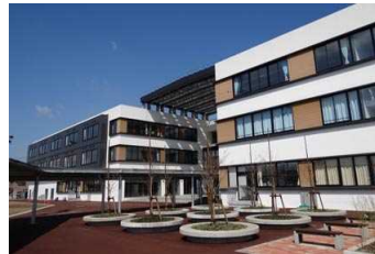
嵐南小学校、第一中学校