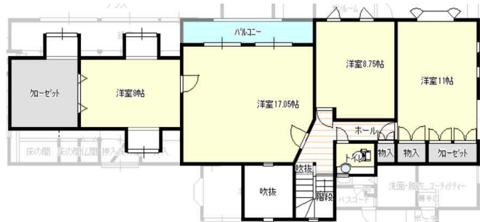
↑住居 2階平面図 ↓住居 1階平面図